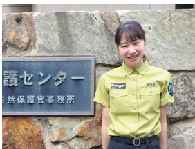
対馬野生生物保護センター アクティブレンジャー