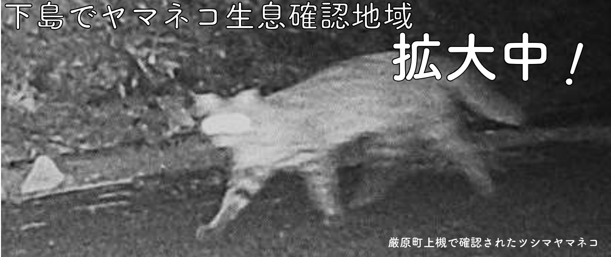
厳原町上槻で確認されたツシマヤマネコ

一度は生息の確認が途絶えてしまった下島のヤマネコですが、平成19年3月に厳原町内山で生息が確認されて以来、少しずつ生息確認地域が広がっています。生息確認は主に自動撮影カメラと痕跡調査によって行われています。令和5年度には、新たに3カ所（厳原町北里・下原・上槻～久根浜周辺）で生息が確認され、1カ所（厳原町久根田舎周辺）ではメスの生息が確認されました。上島に比べると下島でのヤマネコの生息はまだ安定しているとは言えませんが、島内どこでもヤマネコに遭遇する可能性があります。これにより、上島で発生しているような交通事故や錯誤捕獲などの人為的な要因での死傷が下島でも増加する可能性があります。実際に、下島と上島を結ぶ美津島町大山では、今年の1月2日と2月17日に立て続けに交通事故が発生しました。また、美津島町洲藻では昨年4月に錯誤捕獲されたヤマネコ（Beny Sumo）