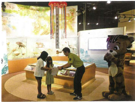
▲30万人目の来館者様。来てくれてありがとう！

野生生物保護センターは令和5年8月31日に来館者30万人を達成しました。平成9年に開館以来、島内外の多くの方々にお越しいただき、皆様の温かい支援によりここまで来られましたことに感謝申し上げます。これからもツシマヤマネコをはじめとする対馬の自然の素晴らしさ、大切さを伝える展示・体験を提供していきます。