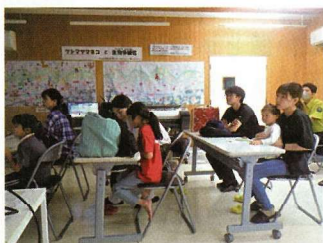
▲ステーションのツシマヤマネコ講義もあります。

普段は非公開の施設ですが、今年からヤマネコ応援団と共催で一般の方々を募り、そばまき（夏）、そばの花見（初秋）、そば刈り（秋）、そばの脱穀（冬）のイベントを開催しています。ツシマヤマネコに詳しくなり、気軽な職場体験ができると好評です。来年もイベントを開催する予定ですので、興味を持たれた方は是非参加してくださいね。