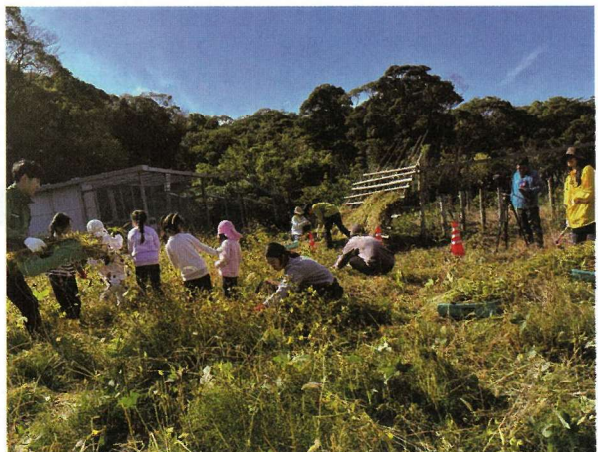
▶そば刈りでは、みんなよく働いて、なんとか刈り終わりました。