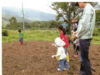
▲そばまきの様子。芽が出ますように～とみんなが播きました。