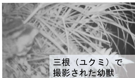
三根(ユクミ)で 撮影された幼獣