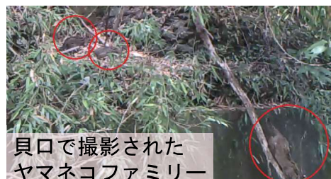
貝口で撮影された ヤマネコファミリー